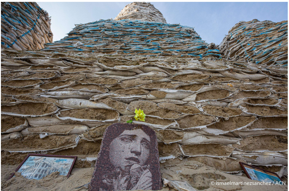
Sochu sv. Oľgy v Kyjeve počas vojny chránia vrecia s pieskom

Ukrižovaný Ježišu, zmluj sa nad nami. Aj nad dušami v očistci.