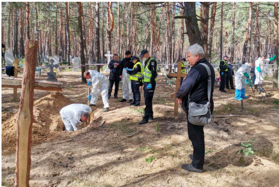
Exhumácia masových hrobov v lese v Izjume neďaleko Charkova v roku 2023.

Ukrižovaný Ježišu, zmiluj sa nad nami. Aj nad dušami v očistci.